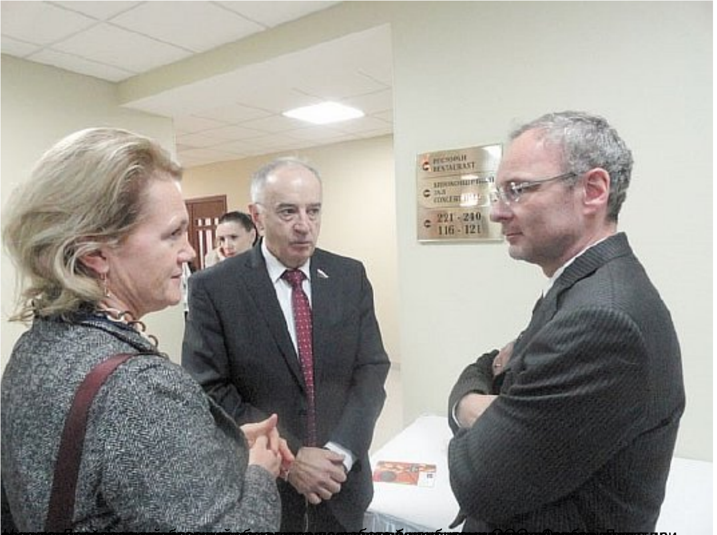
Председатель Союза мороженщиков России и вице-президент Союза кондитеров России в разговоре с директором ресторана «Солнечный».