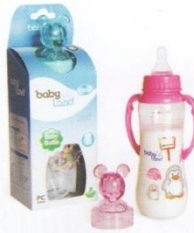
Бутылочки, погремушка, соски-пустышки