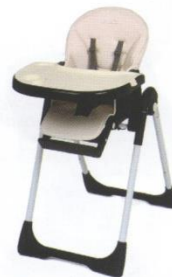
Стульчик для кормления с регулируемой спинкой