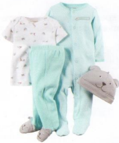
Одежда для дома