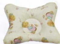
Ортопедическая подушка в форме бабочки