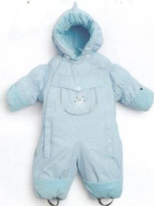
Комбинезон зимний, шапочка

иммунитет малыша. И тут же обратилась к «давнему другу», пищевой добавке, повышающей лактацию, к «Млечному пути» компании «Витапром».