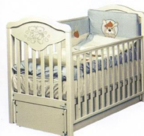
Кроватка, матрас, бортики, комплект постельного белья, подушка, балдахин