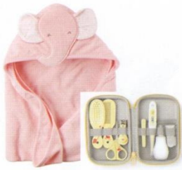
Полотенце с уголком набор для ухода за ребенком