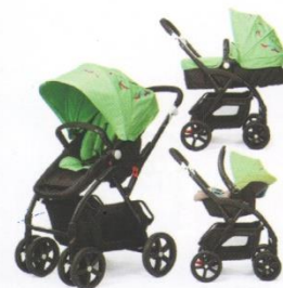
Коляска 3 в 1 (+автокресло)

С последним ребенком я решила любой ценой бороться за достаточное количество молока, ведь это поможет укрепить