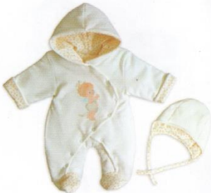
Комбинезон весна-осень, трикотажная шапочка