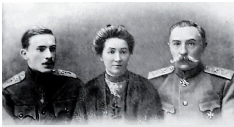
А.Л. Чижевский, О.В. Лесли-Чижевская, Л.В. Чижевский. 1917 г.

С 1918 года Калуге в доме своего отца в течение трех лет ставил опыты в области аэроионизации. Экспериментальные исследования дали четкий результат: положительно заряженные ионы воздуха негативно влияют на живые организмы, а отрицательно