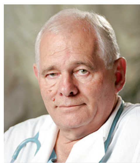
Леонид Рошаль, президент Национальной медицинской палаты