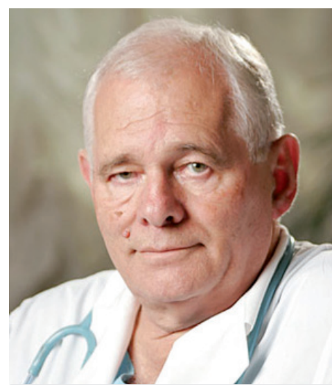
Леонид Рошаль, президент Национальной медицинской палаты