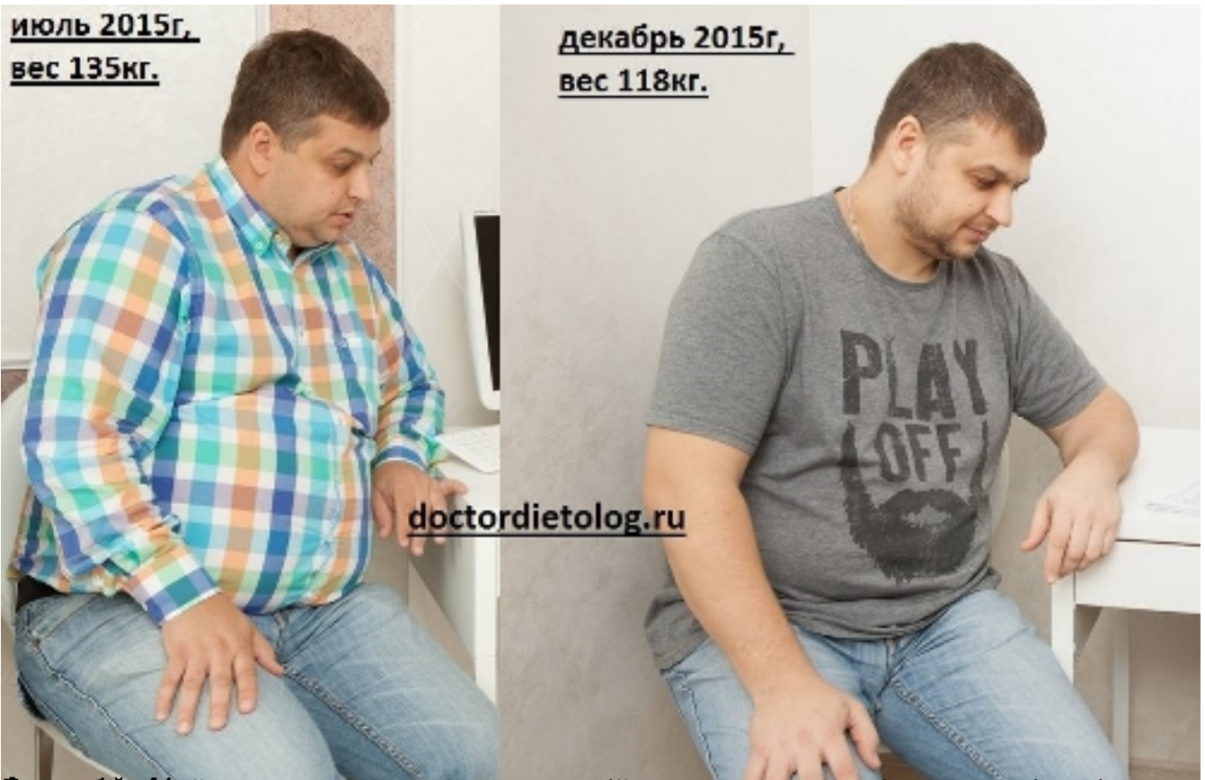
июль 2015г, вес 135кг.