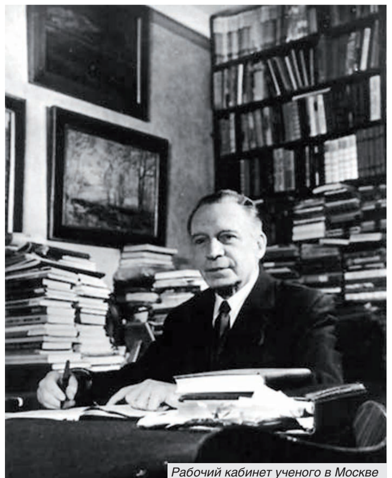
Рабочий кабинет ученого в Москве