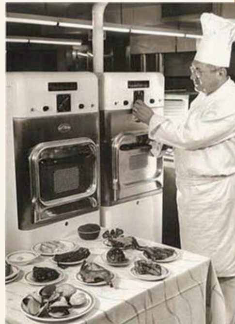
Первая микроволновая печь весила около 340 кг и была размером с холодильник

ских столовых и столовых военных госпиталей). Её высота была примерно равна человеческому росту, масса 340 кг, мощность — 3 кВт, что примерно в два раза больше мощности современной бытовой СВЧ-печи. В 1949 году началось их серийное производство. Стоила эта печь около 3000 $.