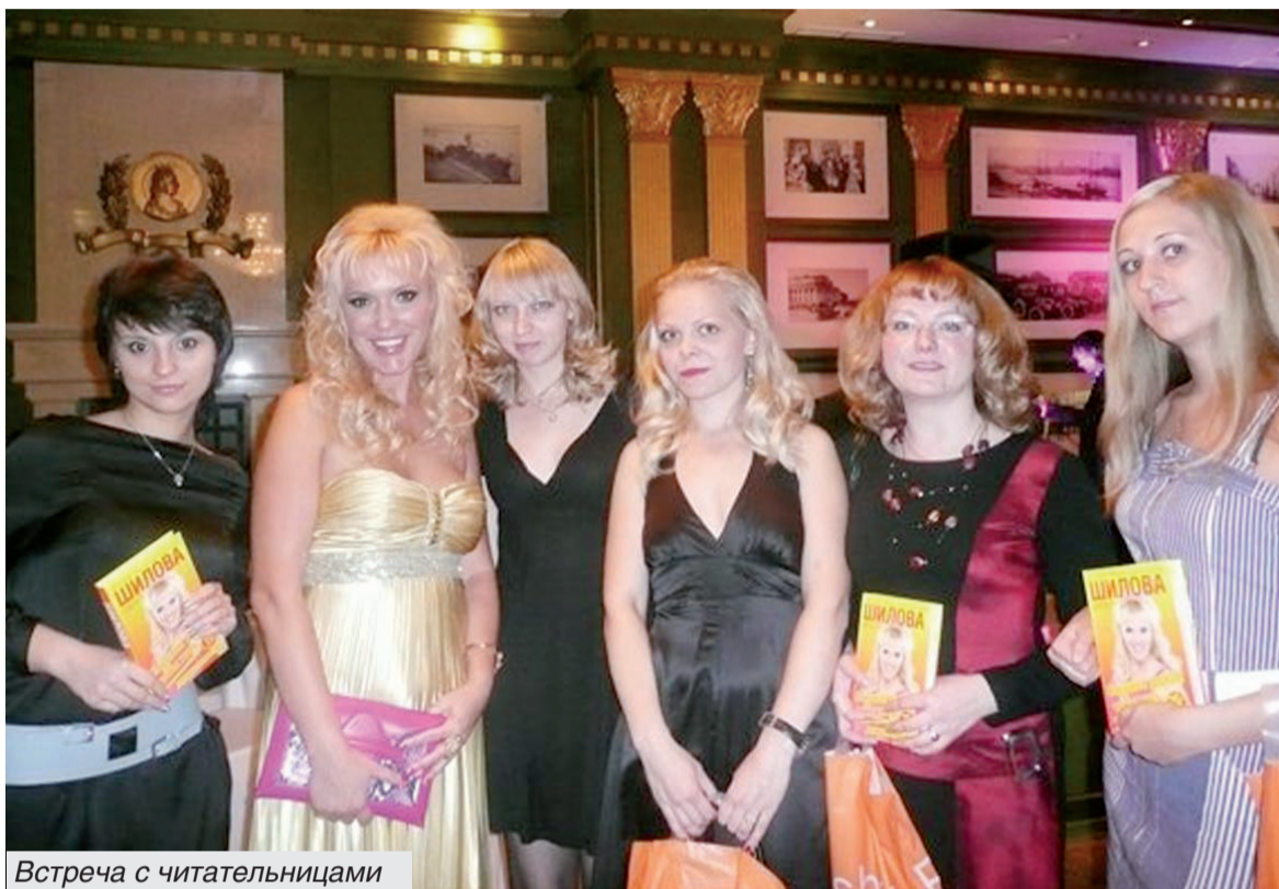
Встреча с читательницами