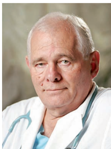
Леонид Рошал Президент Национальной медицинской палаты

Национальная медицинская палата была создана полтора года назад и сейчас объединяет более 60 профессиональных медицинских организаций всей страны. Сегодня приоритетные направления ее деятельности – изменение законодательного поля в сфере здравоохранения, защита пациентов от некачественного лечения и врачебных ошибок и защита медицинского сообщества от неоправданных судебных решений. НМП развивает независимую экспертизу качества медицинской помощи, и работает над внедрением в стране системы саморегулирования профессиональной деятельности и непрерывного последипломного бесплатного образования для врачей.