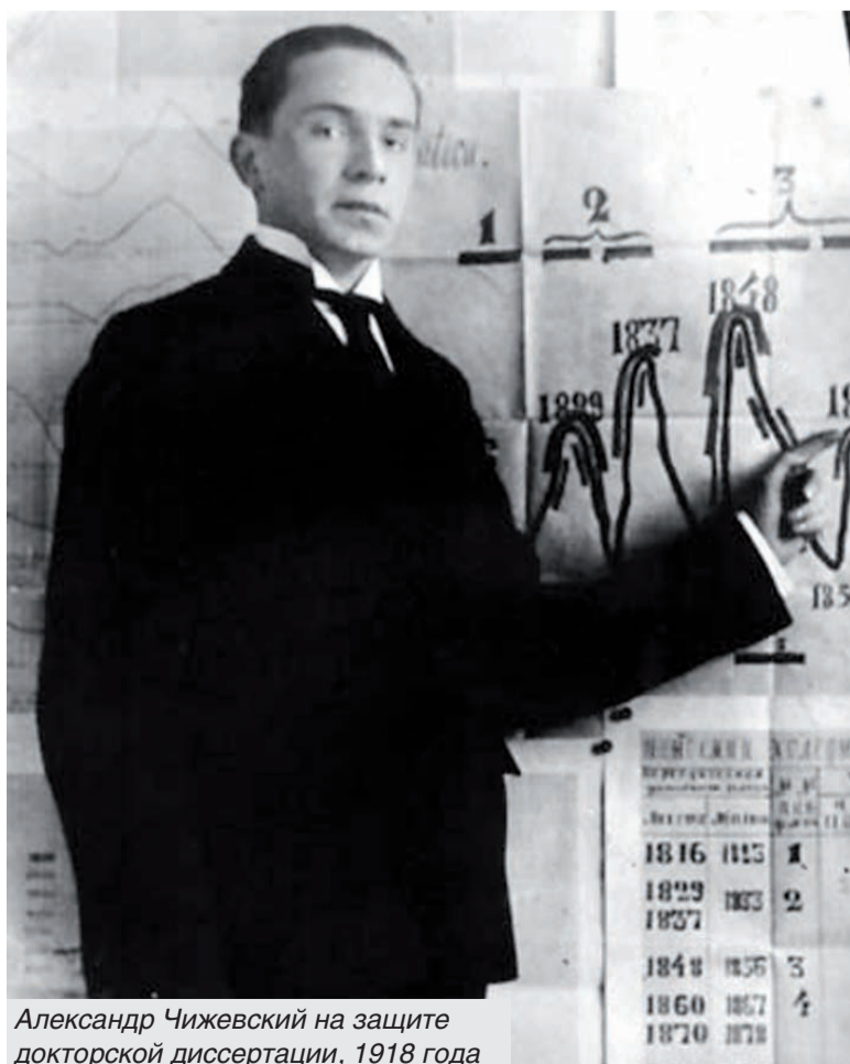
Александр Чижевский на защите докторской диссертации, 1918 года

В Калуге в 2000 году был открыт научно-мемориальный и культурный центр А.Л. Чижевского. Он находился в доме по ул. Московская, 62, в котором Александр Леонидович жил и работал почти 15 лет. В 2010 году, после капитального ремонта и восстановления здания, там открыт дом-музей ученого, создана новая экспозиция.