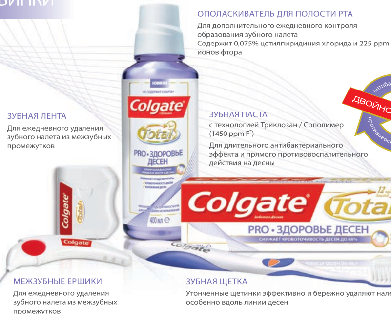
ЗУБНАЯ ЛЕНТА Для ежедневного удаления зубного налета из межзубных промежутков