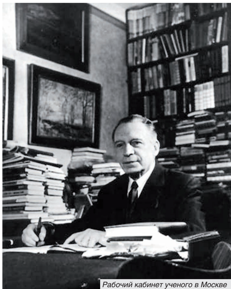
Рабочий кабинет ученого в Москве