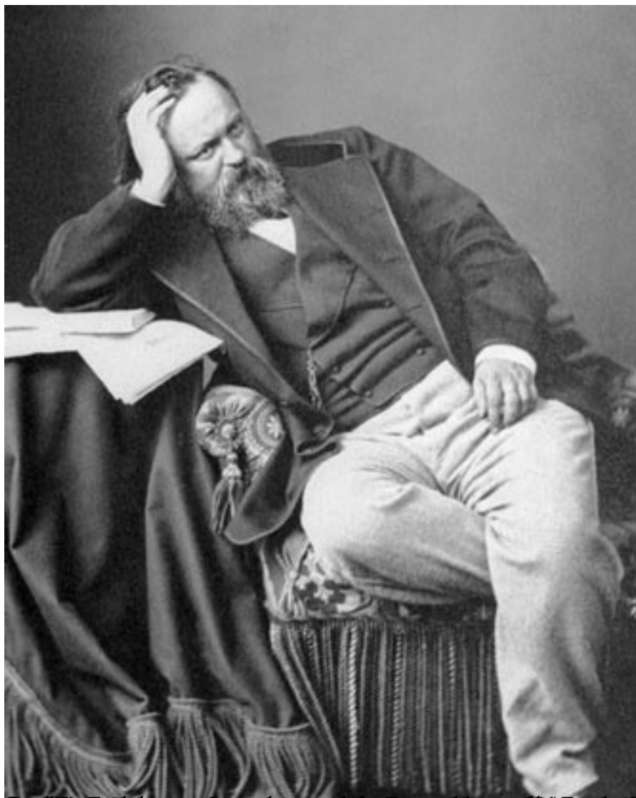
Рис. 1. Герцен в 1849 году.