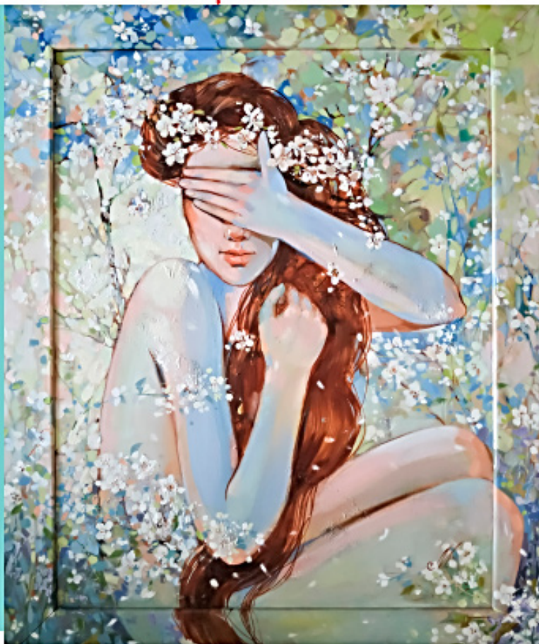
«Цветение» 55 на 70 см. Холст, масло.

дила в Московском общественном фонде культуры и называлась «Чемоданное настроение». Были полупрофессиональные, когда с