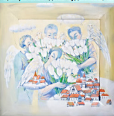
«Цветы для любимых» 30 на 30 см. Холст, масло.

границей во многих странах. Для персональной выставки необходимо довольно много работ собрать. Так как я живу за счёт картин, то стараюсь работы продавать. Не могу писать сразу на продажу и для себя. Мне не хватает на всё сил. Поэтому на персональную выставку собирала свои работы из частных коллекций, галерей. Набралось отовсюду. Но это долгий и трудоёмкий процесс.