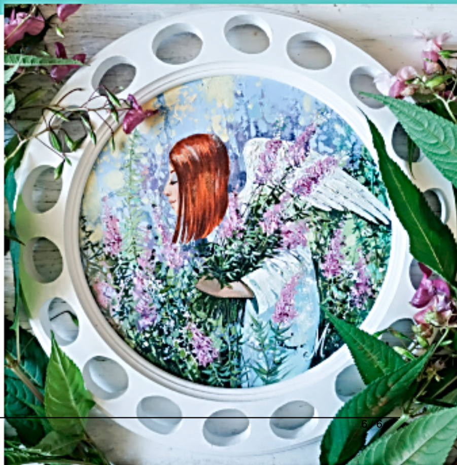
«Середина лета» 40 см Холст, масло