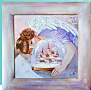
«Снежный шар» 30 на 30 см. Холст, масло.

другим художником делим выставочное пространство пополам. Выставки проходили в Манеже, Центральном доме художника, за-