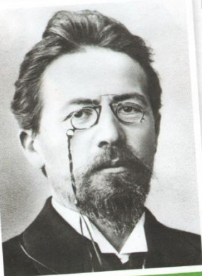
Антон Павлович Чехов

К рым имеет богатейшую историю. Многие народности проживали на его территории. Каждый внес свой вклад в развитие истории. Многие писатели и художники посвящали полуострову и Чёрному морю произведения искусства. Александр Пушкин, Лев Толстой писали книги об этих местах. Величественные волны и просторы Чёрного моря навсегда запечатлены на картинах Ивана Айвазовского, Константина Коровина и Архипа Куинджи. Эти люди приезжали в Крым за вдохновением, отдыхом и лечением. Многие знают, что Антон Чехов очень любил Крым и ездил туда за творческим вдохновением. Он сам говорил: «Удрал бы в Крым, сел бы там под кипарис и написал бы роман...». С проявлением болезни Чехов переехал на полуостров жить и лечиться от туберкулёза легких. Некоторые санатории и бальнеоло-