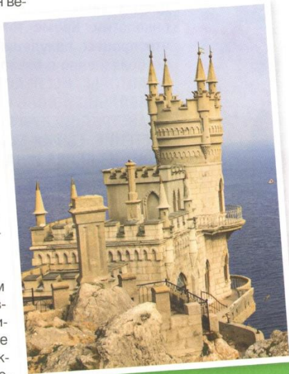
«Ласточкино гнездо» — памятник архитектуры и истории, расположенный на отвесной 40-метровой Аврориной скале мыса Ай-Тодор в посёлке Гаспра на южном берегу Крыма.

– город с богатейшей историей. Там расположено множество памятников архитектуры и музеев. Массандровский и Ливадийский дворцы поражают своей архитектурой и живописными видами. Это были резиденции царской семьи Романовых. Обязательно выделите время, чтобы посетить Никитский ботанический сад. Там собраны редкие виды цветов и деревьев, которые можно увидеть