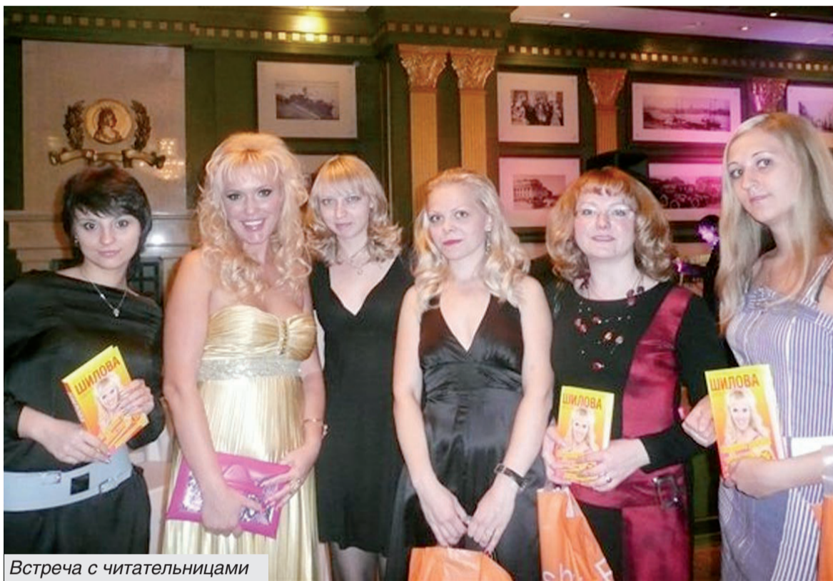
Встреча с читательницами