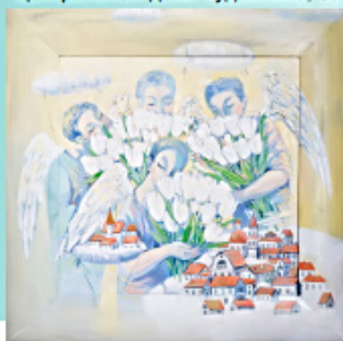
«Цветы для любимых» 30 на 30 см. Холст, масло.

границей во многих странах. Для персональной выставки необходимо довольно много работ собрать. Так как я живу за счёт картин, то стараюсь работы продавать. Не могу писать сразу на продажу и для себя. Мне не хватает на всё сил. Поэтому на персональную выставку собирала свои работы из частных коллекций, галерей. Набралось отовсюду. Но это долгий и трудоёмкий процесс.