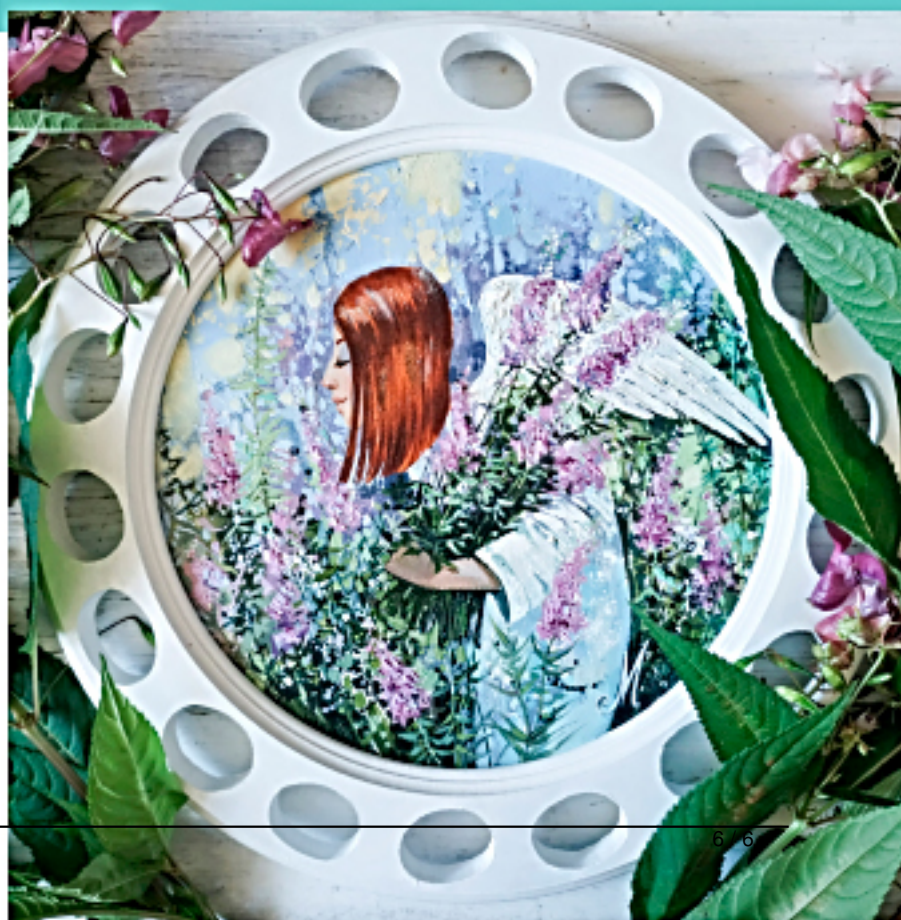
«Середина лета» 40 см Холст, масло

Беседовала Диана Ключко