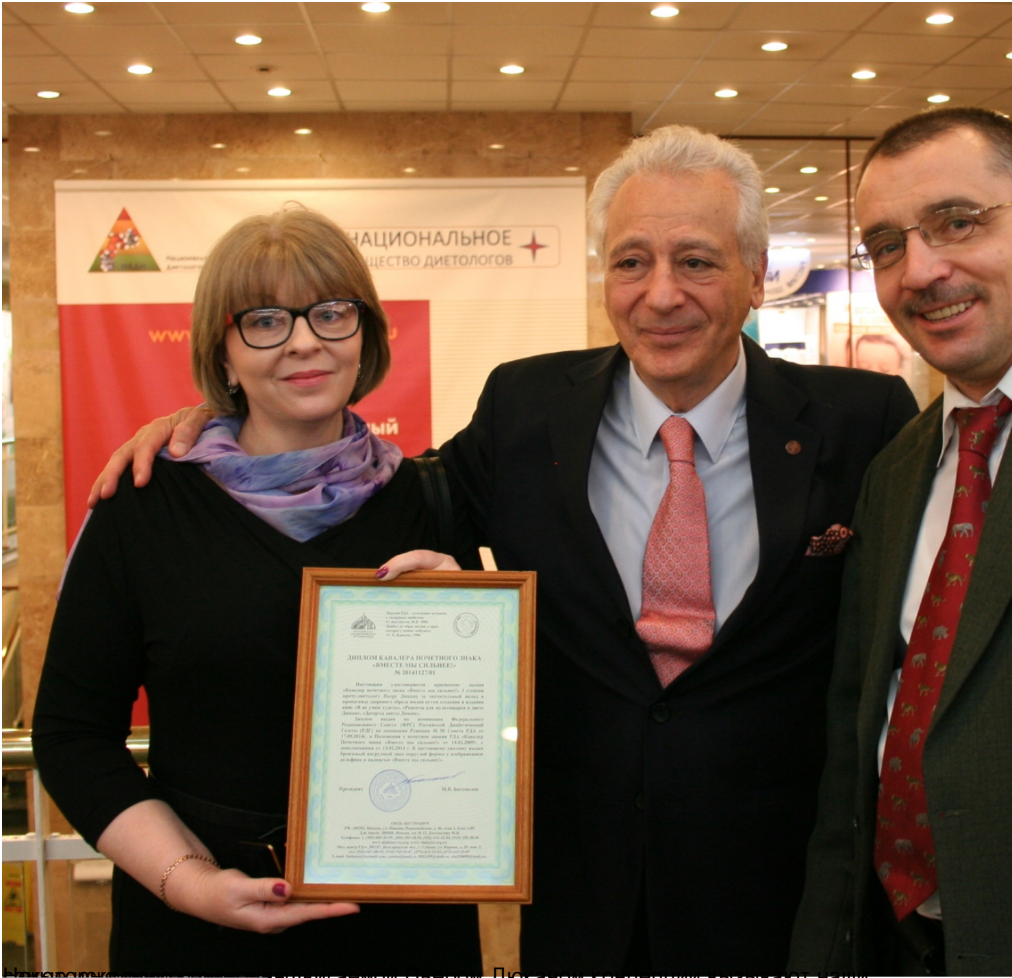
Награждение нашей представительницы в области диетологии Пьером Дюканом за выдающиеся достижения в области диетологии