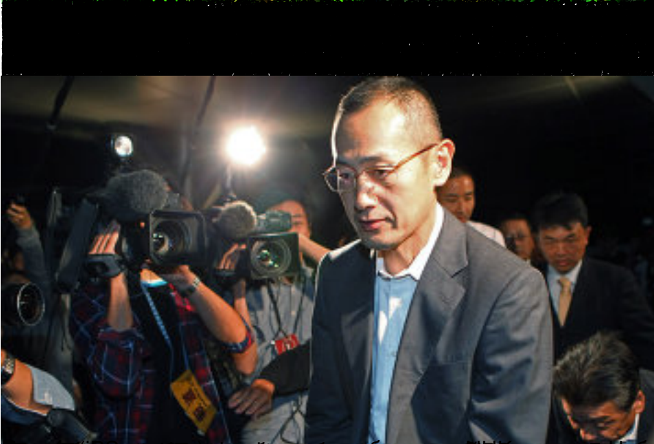
Джон Блюмберг, лауреат Нобелевской премии. За