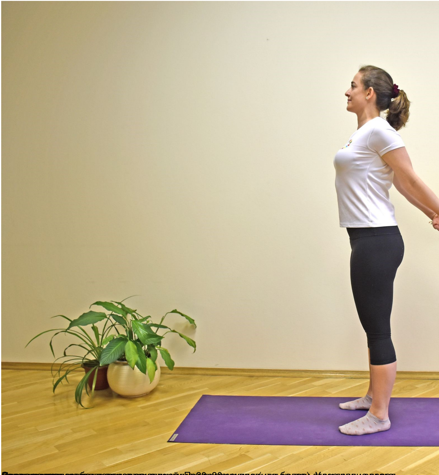
Поза для коррекции осанки (для начинающих). Подборка упражнений (для начинающих). Угол наклона вперед.